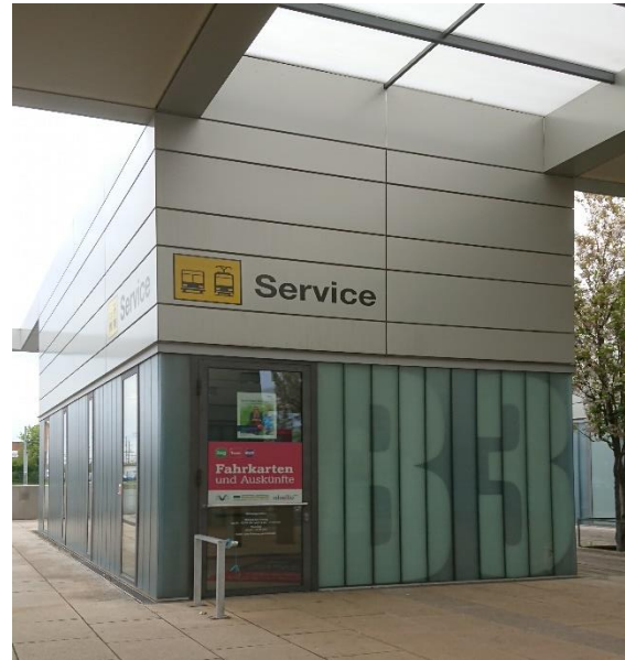
Kundenzentrum von NVG und TWSB Gotha Hauptbahnhof (Terminal am Bahnhofsvorplatz, Modul B3)

Teilen Sie uns bitte schriftlich, unter Angabe Ihrer Abo-Kundennummer, den Wechsel zum Job-Ticket mit und senden Sie ggf. die nicht in Anspruch genommenen Abo-Monatskarten an die NVG zurück.